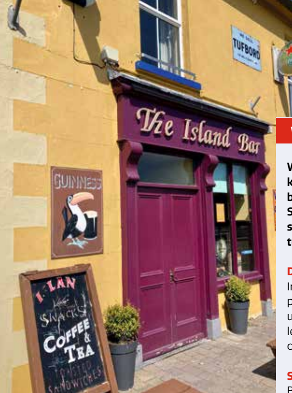
◀ De onvermijdelijke Ierse pub op Our Ladies Island.